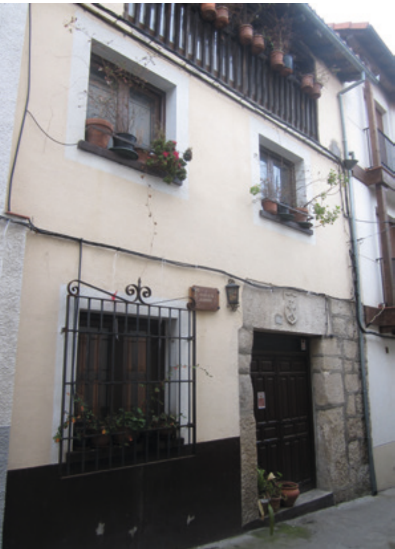
Een Joods huis heeft altijd een stuk onbepleisterde muur.

18 v.v.). Dat is voor David de aanwijzing van de plaats voor de tempelbouw. Hij geeft opdracht tot alle voorbereidingen voor de bouw van een heiligdom voor God, dat uiteindelijk door zijn zoon Salomo gerealiseerd zal worden (1 Kron. 21-28 en 2 Kron. 3-7). De plek waar de engel des Heren blijft staan, is de rots van Moria, de fundamentsteen van de aarde, de navel van de wereld. Straks zal de ark van het verbond met de stenen tafelen van de Thora rusten in het heilige der heiligen op deze steen. De beweging die in Genesis 14 begonnen is, komt hier tot haar doel: een woning voor de God van Israël, een plaats waar zijn Naam zich zal vestigen. Dat wordt het geestelijk middelpunt, het spirituele brandpunt van de wereld als de Sjechiena , de aanwezigheid van de Eeuwige, in de gestalte van een wolk zijn intrek neemt in het heiligdom. Alle gebeden van Israël en van de volkeren stijgen via deze spirituele plek naar de hemelse troon van God. Hemel en aarde raken hier elkaar. Vandaar dat Jeruzalem volgens Psalm 122 'wel samengevoegd' is (vers 3). Volgens de Talmoed duidt dit op de relatie tussen het aards en het hemels Jeruzalem, die 'hecht