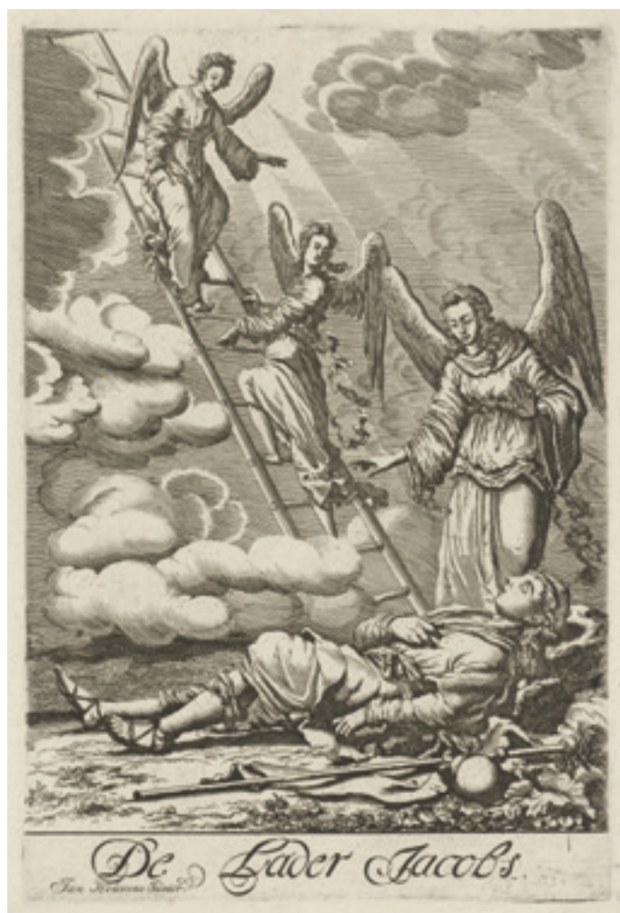
De droom van Jakob; Jan Luyken (1705-1707) (Rijksmuseum Amsterdam)

Hij rust op de even sjtija en heeft de wonderlijke droom van een ladder naar de hemel, waarlangs de engelen omhoog en omlaag gaan. Wakker geworden noemt hij de naam van die plaats 'huis van God, poort van de hemel' (Gen. 28:17). Later